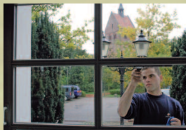
++ Pressemeldung ++ Reinigungsgutschein im Haus Brandstätter wurde eingelöst. Mehr dazu unter www.reinrein.de