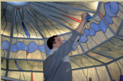
Glanzeleistungen in Bad Zwischenahn